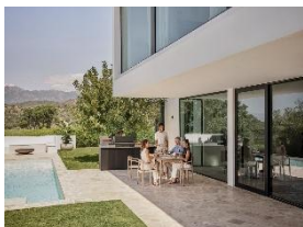
Photo 5 : "Dreams" permet aux clientes et clients de réaliser la cuisine d'extérieur de leurs rêves. La première cuisine d'extérieur de Miele a été créée conjointement avec l'entreprise spécialisée dans les barbecues Otto Wilde Grillers, que Miele a rachetée en 2023.