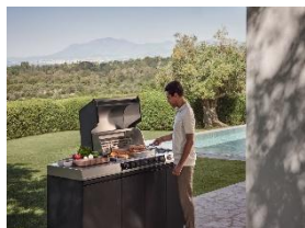
Photo 2 : Avec ses cinq capteurs placés dans l'enceinte et sur la grille, le Fire Pro IQ régule les températures avec plus de précision que n'importe quel autre barbecue. Et pour encore plus de confort : il suffit de sélectionner un programme automatique dans l'app Miele, de l'envoyer au Fire Pro IQ et de se laisser guider pas à pas jusqu'au résultat final.